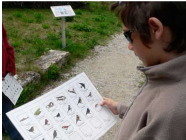
Vereinfachtes Inventar zur Biodiversität in La Sauge.

Im Rahmen des internationalen Jahrs der Biodiversität 2010 möchten viele Lehrpersonen berechtigterweise wissen, wie sie dieses Thema mit ihren Schülerinnen und Schülern behandeln